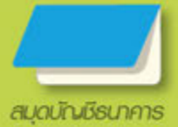
สมุดบัญชีธนาคาร