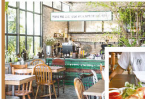
ที่มา : http://www.ananda.co.th/blog/thegenc/7life-style-6-คาเฟ่บ้านนาบ้านบางนา